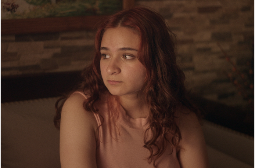
Imagen: Santiago Independiente