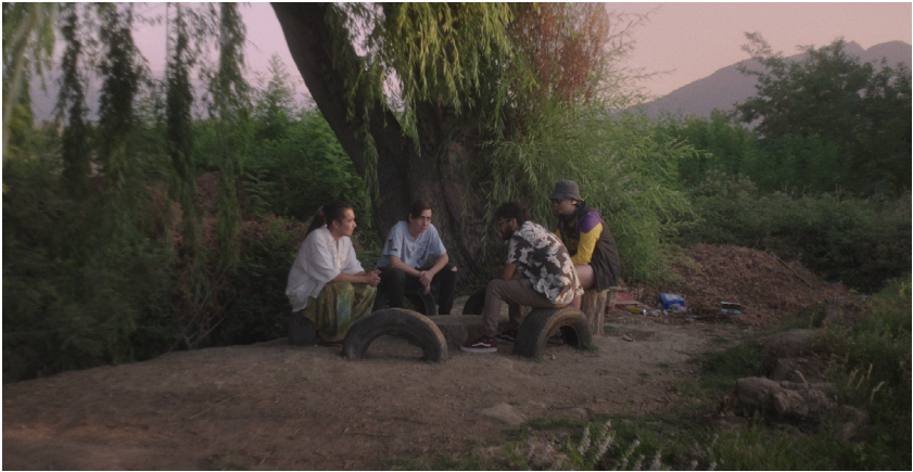
Imagen: Santiago Independiente