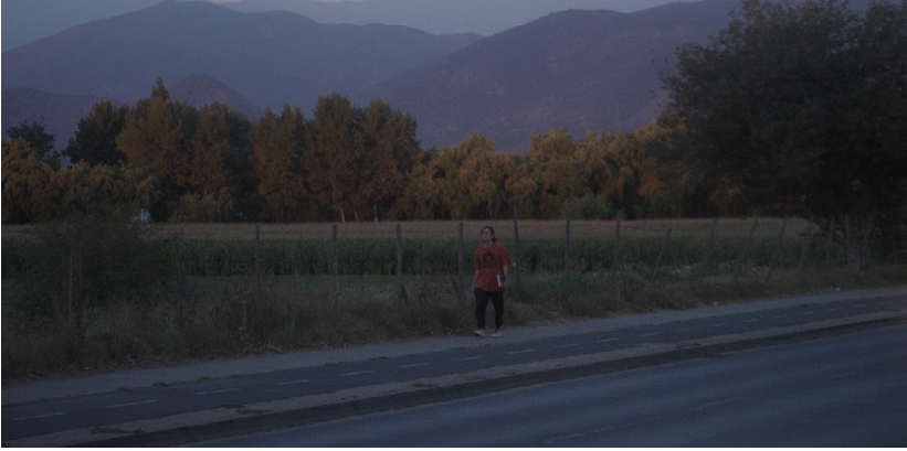
Imagen: Santiago Independiente