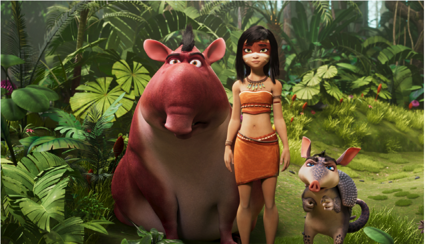
Imagen: BF distribución