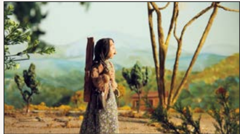
Imagen: Beltrán y Toro Ltda