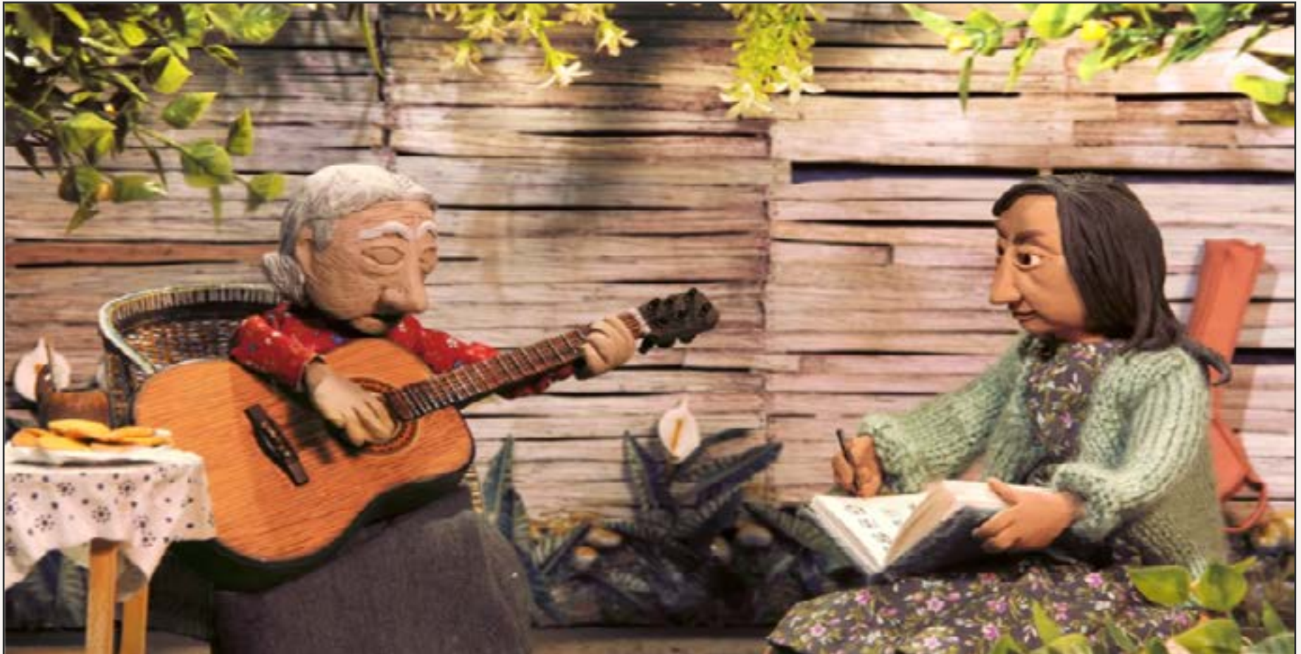
Imagen: Beltrán y Toro Ltda